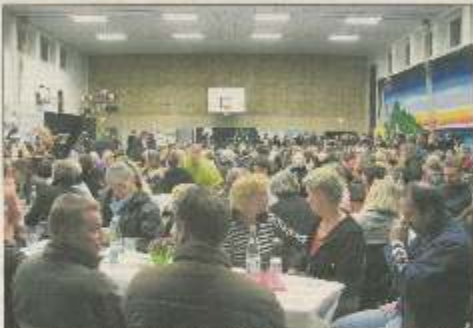
Info-Abend in der Schönbeger Sporthalle war ein großer Erfolg.

Schönbeg - Was ist es, was ist die Idee dahinter? Das sind die Fragen, die sich im vergangenen Freitag, 13. Februar, im Rahmen des Info-Abends in der Schönbeger Sporthalle stellten. Die Schönbeger Elternschaft und die Schönbeger Schulleitung waren an diesem Abend in der Sporthalle zum Info-Abend über die Gemeinschaftsschule Probstei.