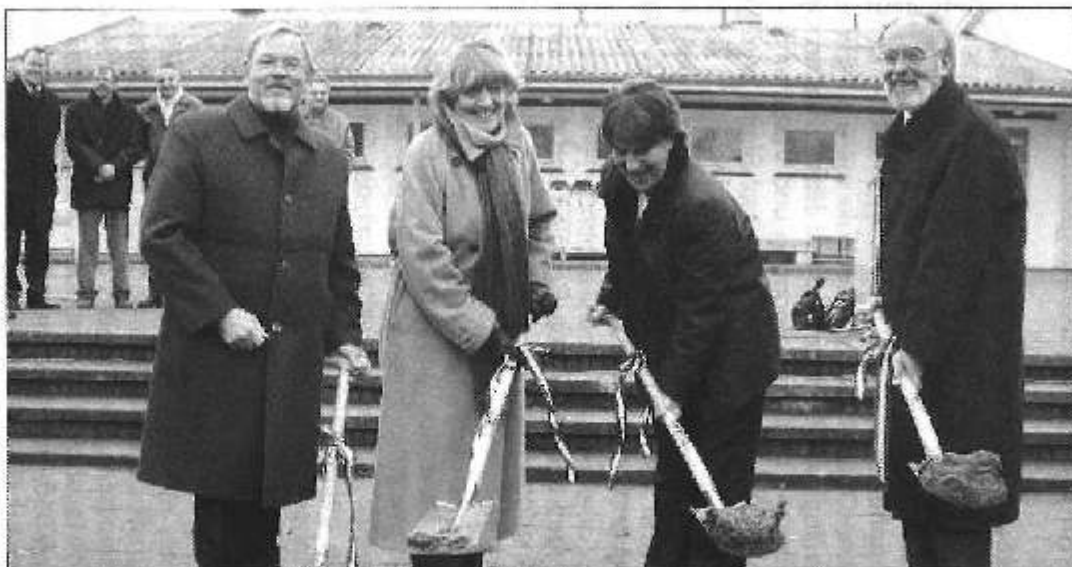
Zur ersten Spatenstich für die offene Ganztagschule in Schönberg angetreten (von links): Schulverbandsvorsteher Helmut Wichelmann, Bürgermeisterin Anja Kain, Bildungsministerin Ute Eidsiek-Parve und Bürgermeister Wilfried Zurstößen.

weitere. mehr! Bürgermeister Wilfried Zurstößen und Blick auf das Investitionsprogramm des Bundes mit seiner filigranten Förderung. Er bedankte sich auch für die „vielblütige Unterstützung aus den Bildungsinstitutionen“. „Ohne die wäre dieses Projekt nicht möglich gewesen.“ Zurstößen referierte über auch an den