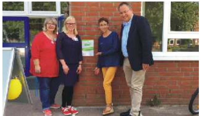
Grundschule an den Salzwiesen