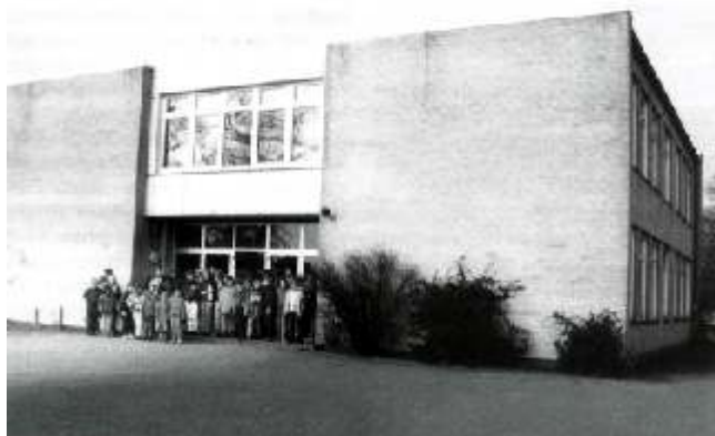
Die Förderschule in Schönberg

Dieses Bild wurde 1975 bei der Grundsteinlegung für die zweite Turnhalle mit eingemauert.