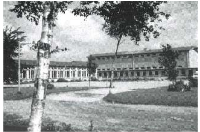
Der Realschul-Neubau am Friedhofsweg