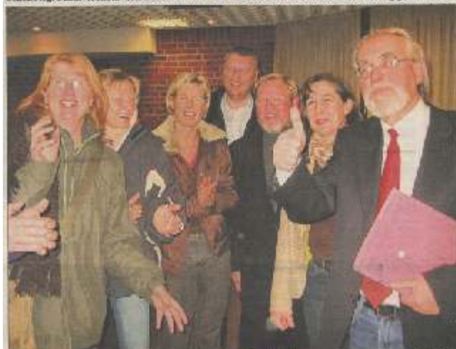
Schüler der Gemeinschaftsschule in Altschönberg.