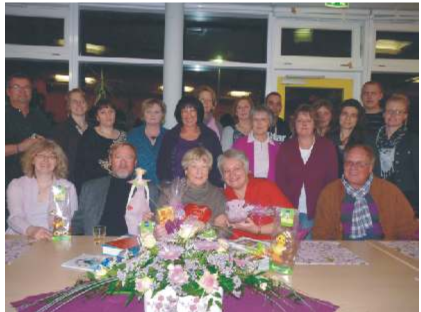
Das Team des Kinder- und Jugendhauses im Feb. 2011

Das gesamte Projekt war ein wichtiger Meilenstein auf dem Weg, der letztlich zur Gemeinschaftsschule und zur gymnasialen Oberstufe führte und der belegt, dass Schule bei uns bis auf den heutigen Tag etwas Besonderes ist.